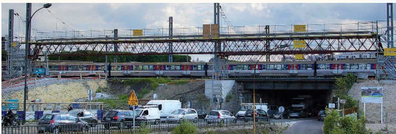
Passerelle le long des voies SNCF quais de Clichy à Levallois-Perret (92).